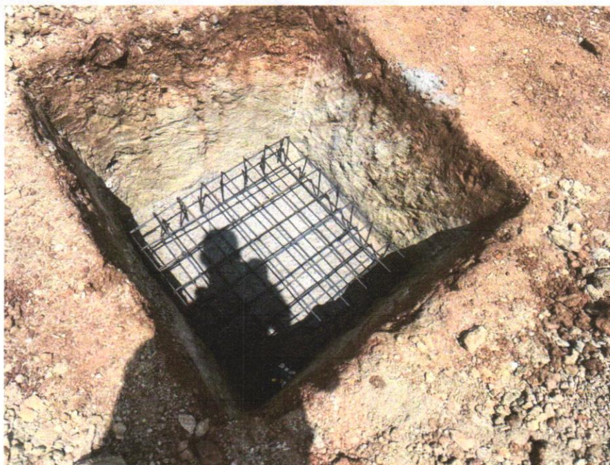
IMAGEM 14 – CORTE E DOBRA DE AÇO CA-50, DIÂMETRO DE 8,0 MM, UTILIZADO EM ESTRUTURAS DIVERSAS, EXCETO LAJES. AF_12/2015

RIACHÃO DO JACUIPE-BAHIA, 30 DE OUTUBRO DE 2024