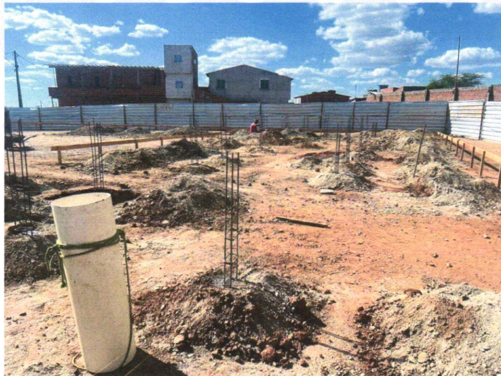
IMAGEM 08 - ATERRO MANUAL DE VALAS COM SOLO ARGILLO-ARENOSO E COMPACTAÇÃO RIACHÃO DO JACUIPE-BAHIA, 30 DE OUTUBRO DE 2024