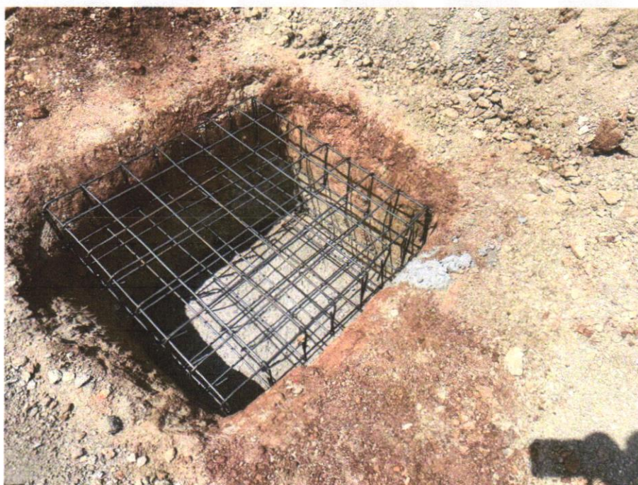
IMAGEM 16 - CORTE E DOBRA DE AÇO CA-60, DIÂMETRO DE 5,0 MM, UTILIZADO EM RIACHÃO DO JACUIPE-BAHIA, 30 DE OUTUBRO DE 2024