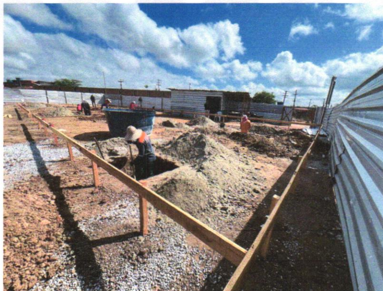
IMAGEM 10 ESCAVAÇÃO MANUAL DE VALA COM PROFUNDIDADE MENOR OU IGUAL A 1,30 M. AF_02/2021.