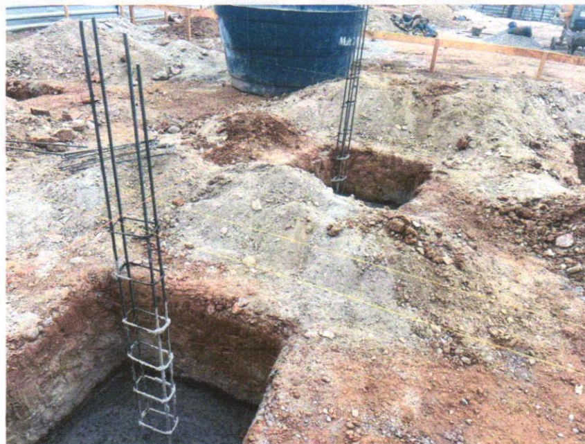
IMAGEM 18 - CONCRETAGEM DE PILARES, FCK = 25 MPA, COM USO DE BOMBA EM EDIFICAÇÃO COM SEÇÃO MÉDIA DE PILARES MENOR OU IGUAL A 0,25 M 2 - LANÇAMENTO, ADENSAMENTO E ACABAMENTO. AF_12/2015.

RIACHÃO DO JACUIPE-BAHIA, 30 DE OUTUBRO DE 2024