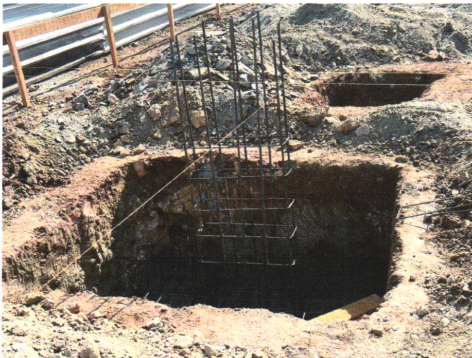
IMAGEM 13 – CORTE E DOBRA DE AÇO CA-50, DIÂMETRO DE 8,0 MM, UTILIZADO EM ESTRUTURAS DIVERSAS, EXCETO LAJES. AF_12/2015.