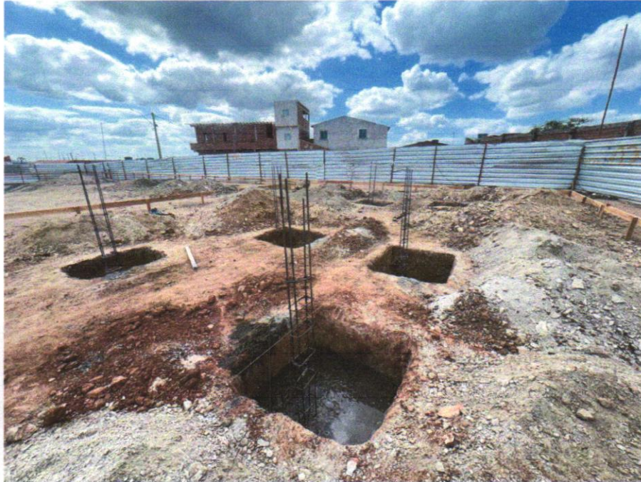
IMAGEM 17 - CONCRETAGEM DE PILARES, FCK = 25 MPA, COM USO DE BOMBA EM EDIFICAÇÃO COM SEÇÃO MÉDIA DE PILARES MENOR OU IGUAL A 0,25 M 2 - LANÇAMENTO, ADENSAMENTO E ACABAMENTO. AF_12/2015.