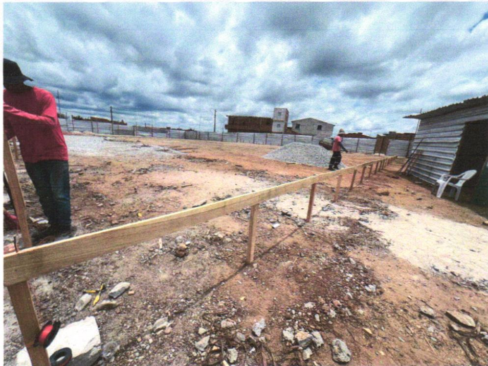
IMAGEM 06 - LOCAÇÃO CONVENCIONAL DE OBRA, ATRAVÉS DE GABARITO DE TABUAS CORRIDAS PONTALETADAS, SEM REAPROVEITAMENTO.

RIACHÃO DO JACUIPE-BAHIA, 30 DE OUTUBRO DE 2024