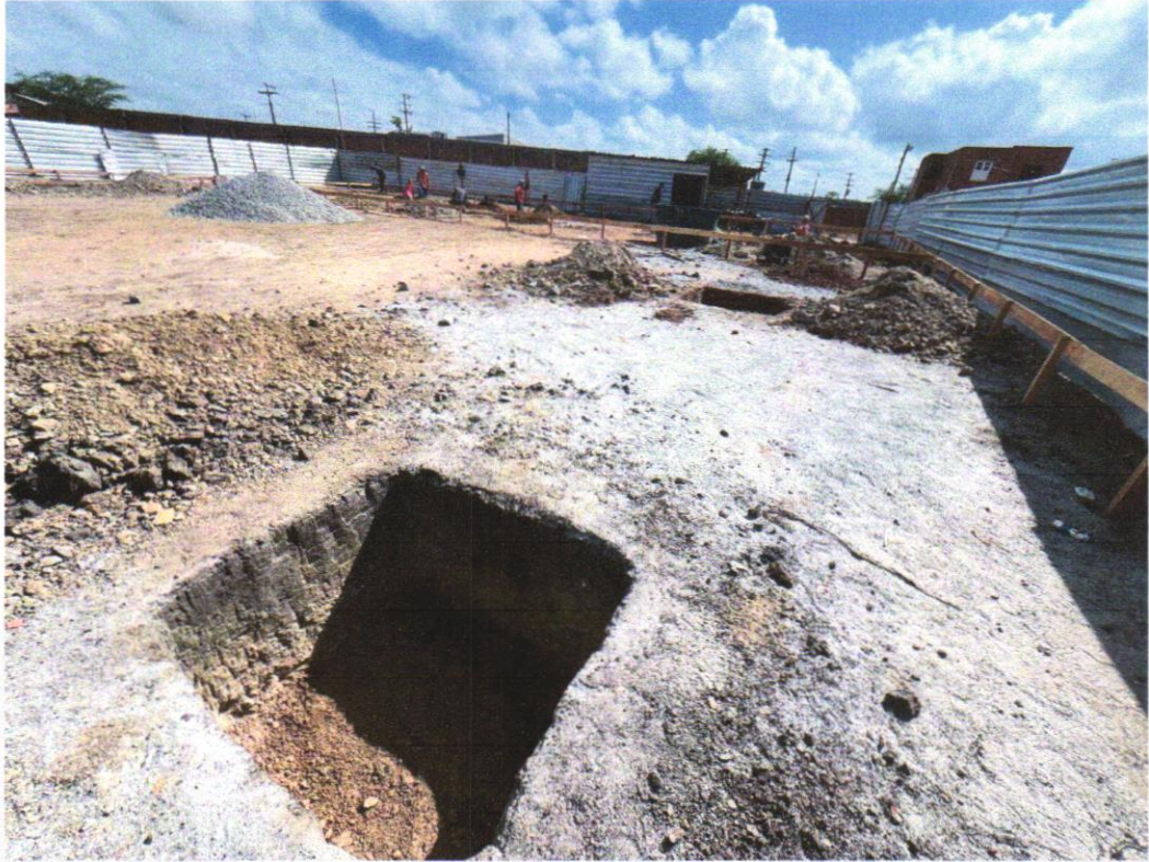
IMAGEM 11 – ESCAVAÇÃO MANUAL DE VALA COM PROFUNDIDADE MENOR OU IGUAL A 1,30 M. AF_02/2021.