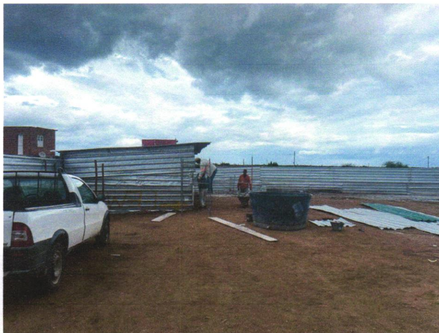
IMAGEM 03 - TAPUME.