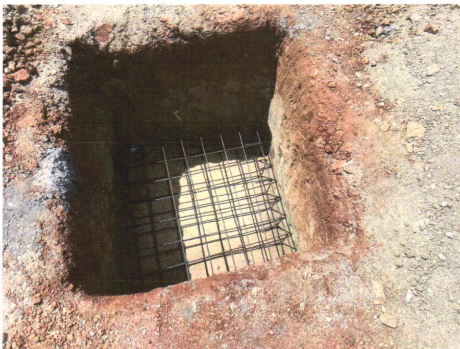
IMAGEM 15 - CORTE E DOBRA DE AÇO CA-60, DIÂMETRO DE 5,0 MM, UTILIZADO EM ESTRUTURAS DIVERSAS, EXCETO LAJES. AF_12/2015.