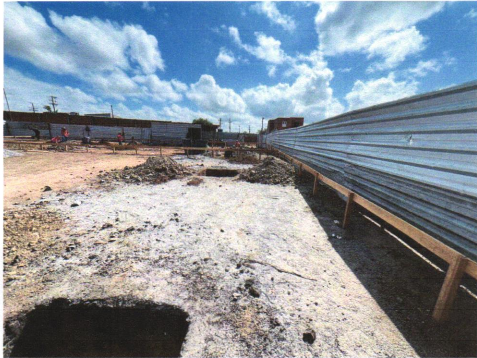
IMAGEM 07 LOCAÇÃO CONVENCIONAL DE OBRA, ATRAVÉS DE GABARITO DE TABUAS CORRIDAS PONTALETADAS, SEM REAPROVEITAMENTO.