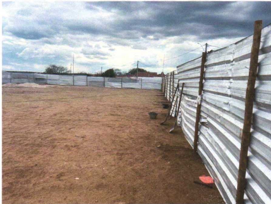
IMAGEM 02 – TAPUME.