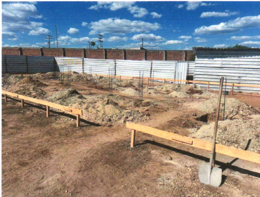
IMAGEM 09 - ATERRO MANUAL DE VALAS COM SOLO ARGILO-ARENOSO E COMPACTAÇÃO MECANIZADA. AF_05/2016.