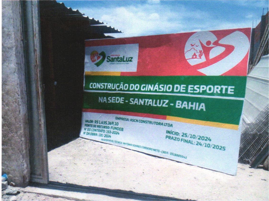
IMAGEM 01 - Placa de obra em chapa aço galvanizado, instalada - Rev 02_01/2022.